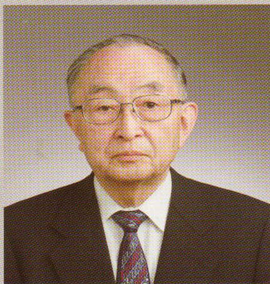
(公財)日本障害者 リハビリテーション協会顧問 元東京大学医学部教授